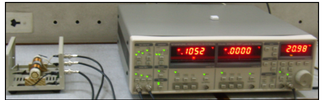
Figura 1: Foto del transformador diferencial y el amplificador Lock-in

Dichos componentes se muestran en las figuras 1 y 2.