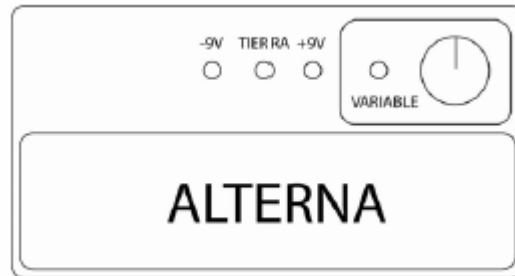
Figura 1: Fuente de Voltaje.

cortocircuitarse la fuente , por lo que si creemos que esto puede ocurrir o no sabemos que es lo que va a ocurrir, debemos colocar una resistencia de protección en serie con la fuente (¿por qué? ¿Qué es un cortocircuito? ¿Cuáles suelen ser las consecuencias de un cortocircuito?). Es conveniente chequear cuál es la corriente máxima que puede entregar la fuente para determinar cuál es el valor de la resistencia de protección que debe utilizarse.