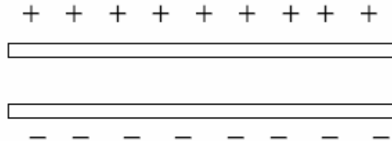
Figura 1: Esquema de un capacitor de placas paralelas.

donde C es la constante de proporcionalidad llamada capacidad o capacitancia. Esta constante depende de las características del capacitor (superficie de placas y distancia de separación, material entre placas). La unidad de la capacitancia es el faradio F = \text{Coulomb/Volt} .